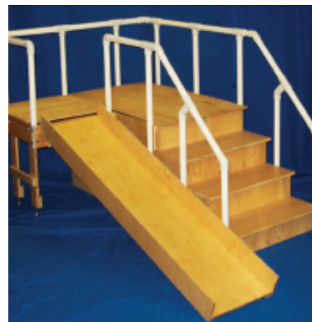
Terrain de jeux intérieur construit sur mesure par Joe Toby du Programme DesignAbility®.