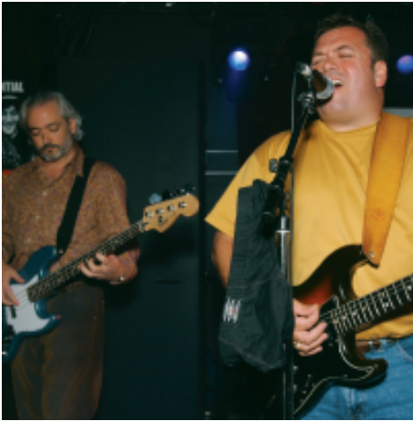
The Tantrums, gagnants du tout premier événement annuel « Rock for Kids ».