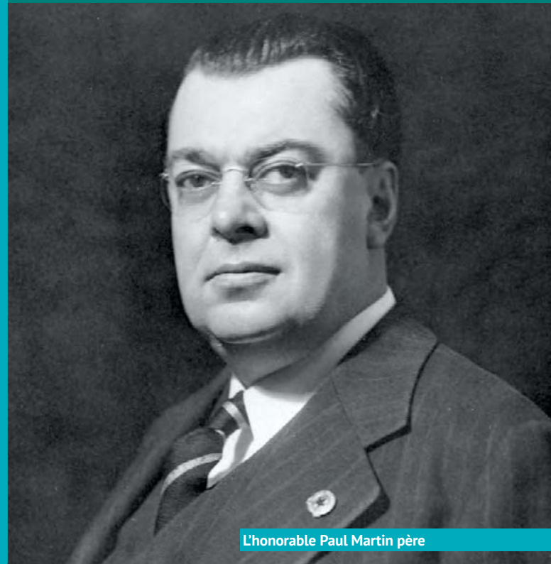
L'honorable Paul Martin père