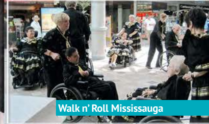
Walk n' Roll Mississauga