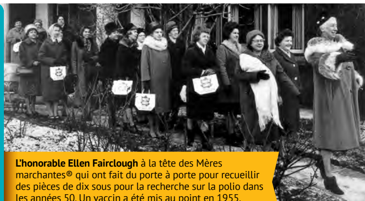
L'honorable Ellen Fairclough à la tête des Mères marchantes® qui ont fait du porte à porte pour recueillir des pièces de dix sous pour la recherche sur la polio dans les années 50. Un vaccin a été mis au point en 1955.

Rend hommage aux généreux donateurs qui font des contributions uniques ou cumulatives de 1 000 $ à 4 999 $. Ellen Fairclough a été la première femme à être élue députée fédérale au Canada. Elle était la présidente honoraire des 40 000 Mères marchantes® de La Marche des dix sous de l'Ontario qui ont fait du porte à porte dans des quartiers partout au Canada pour recueillir des fonds pour la recherche sur la polio. La Société Ellen Fairclough® commémore son esprit de pionnier.