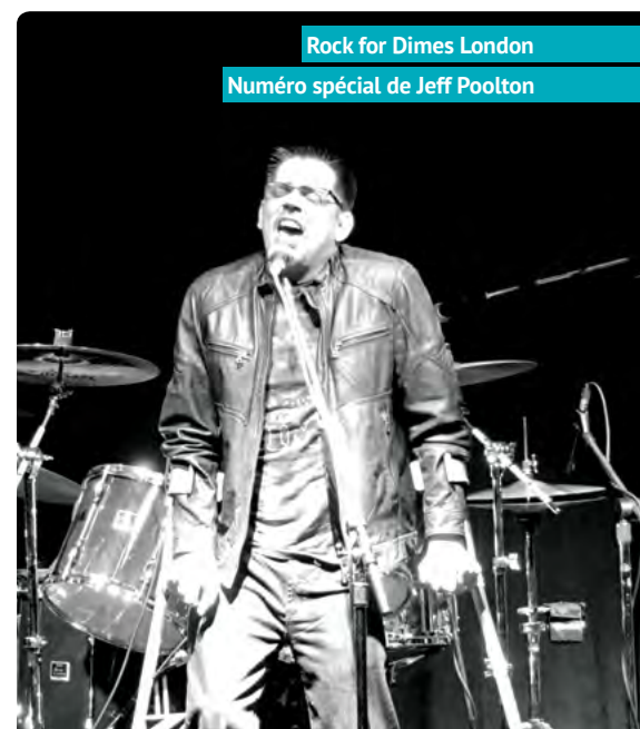
Rock for Dimes London