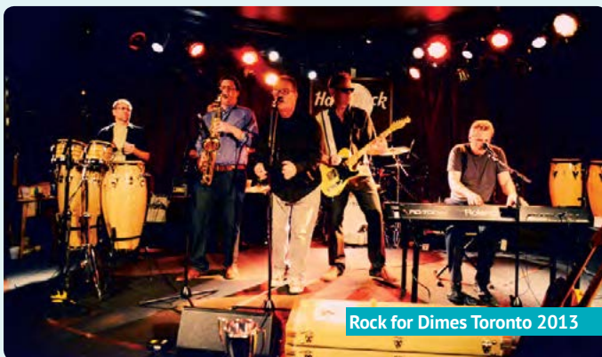
Rock for Dimes Toronto 2013

A mesure que nous étendons nos activités à tout le Canada, nous recherchons des bénévoles pour nous aider à recueillir des fonds, à organiser des événements de sensibilisation à l'invalidité, à diffuser de l'information sur l'accessibilité et à appuyer notre éventail de services.