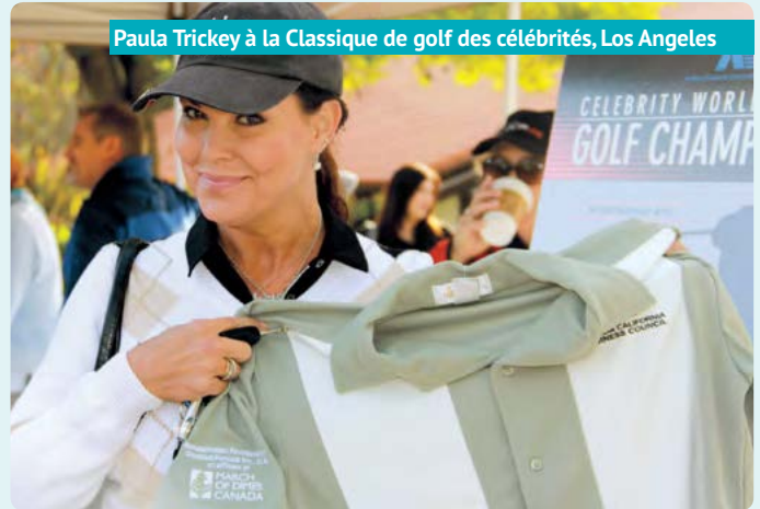
Paula Trickey à la Classique de golf des célébrités, Los Angeles