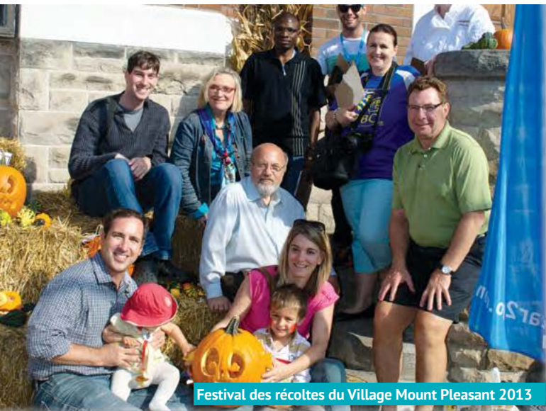
Festival des récoltes du Village Mount Pleasant 2013