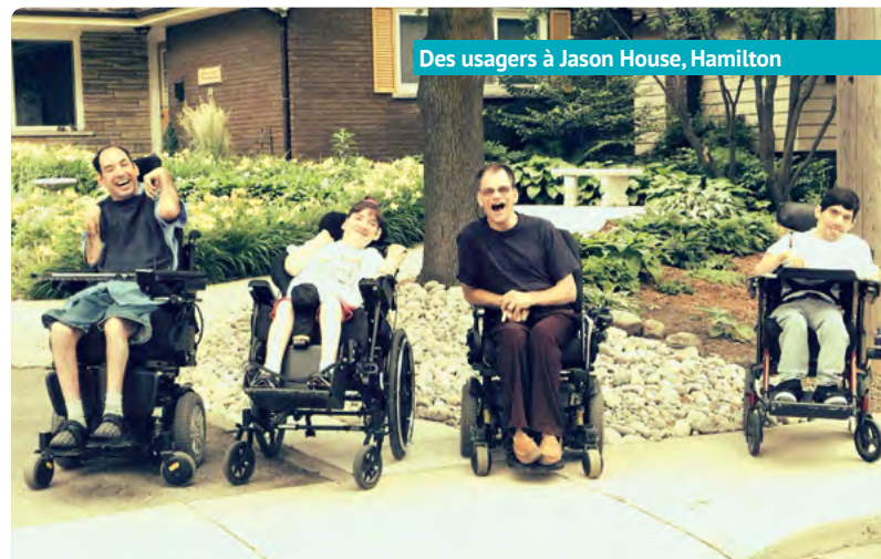
Des usagers à Jason House, Hamilton