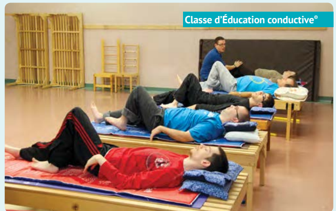
Classe d'Éducation conductive®