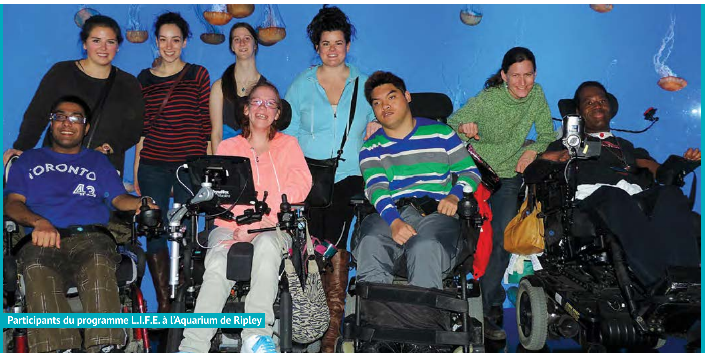
Participants du programme L.I.F.E. à l'Aquarium de Ripley

Ce programme fait l'objet d'un intérêt croissant et la MDSC explore des occasions de lancer d'autres programmes dans des communautés d'autres provinces.