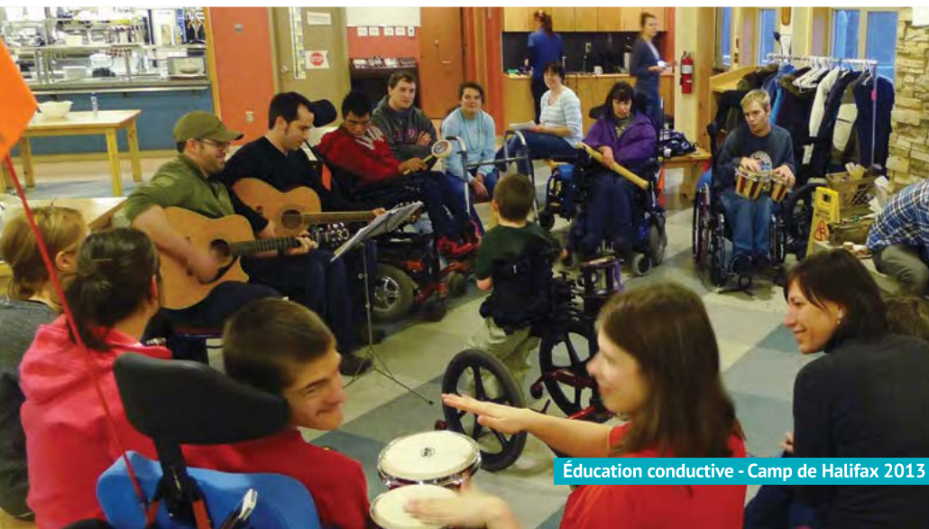
Éducation conductive - Camp de Halifax 2013

L'Éducation conductive® est un système d'apprentissage novateur fondé sur les principes de la neuroplasticité et qui augmente l'habileté physique des personnes qui ont un handicap, améliorant leur mobilité, leur dextérité, leur estime de soi, leur motivation et leur autonomie. Depuis 2000, la MDSC a fourni une aide financière à neuf étudiants pour leur permettre de devenir des conducteurs qualifiés en obtenant un baccalauréat spécialisé et une reconnaissance professionnelle en Angleterre.