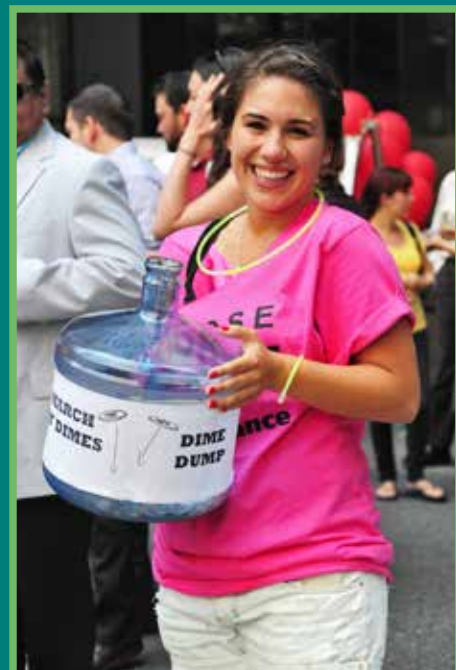
Bénévole de TD