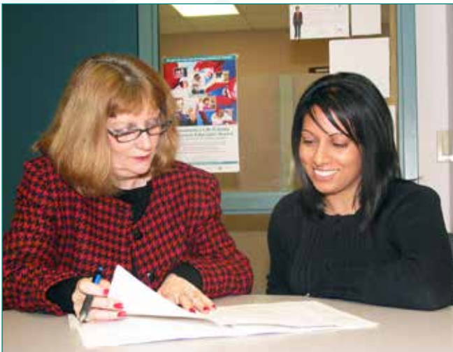
Les Services d'emploi de la Marche des dix sous fournissent une formation en recherche d'emploi