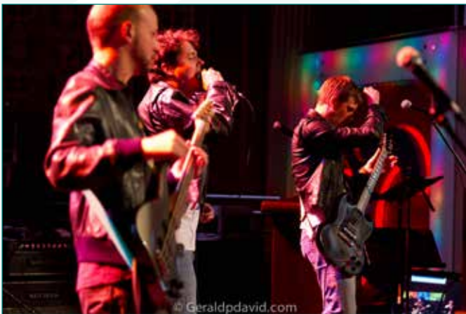
Rock for Dimes Calgary 2013

Le Développement des Fonds a connu une année très fructueuse en 2012-2013, ayant réalisé 15,6 % plus de revenus nets que prévu. Le domaine où le rendement s'est le plus amélioré a été les dons planifiés. À mesure que la MDS continue d'étendre ses programmes au reste du Canada, le Développement des Fonds tente de combler les besoins de tous les programmes financés par les donateurs.