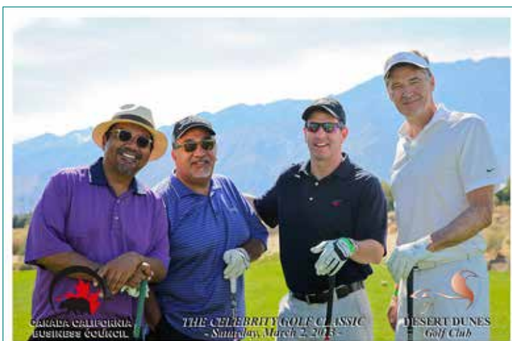
George Lopez (à g.) et ses amis à la Classique de golf des célébrités du CCBC

Suivez-nous sur Twitter à modcanada et sur www.facebook.com/marchofdimescanada .