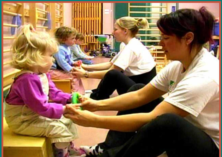
Cours d'Éducation conductive