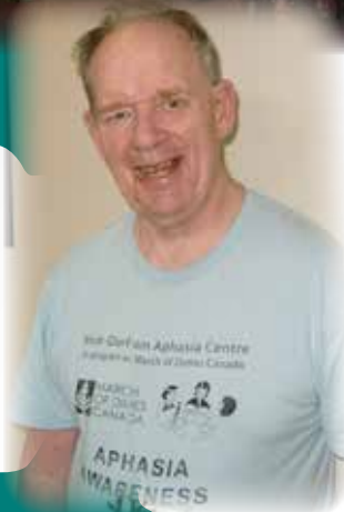
Camp d'aphasie Ontario