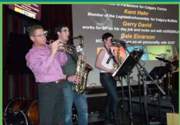
Rock for Dimes Calgary 2012

Les événements Rock for Dimes présentés par Pennzoil, sont une compétition de groupes musicaux qui a lieu dans différentes villes du Canada. Des groupes de musiciens amateurs se livrent une concurrence amicale en vue de remporter le titre du meilleur groupe musical d'entreprise ou amateur. Les groupes démontrent leurs talents devant un panel de professionnels de l'industrie musicale canadienne.