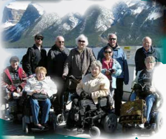
Retraite pour survivants de la polio Bragg Creek, Alberta