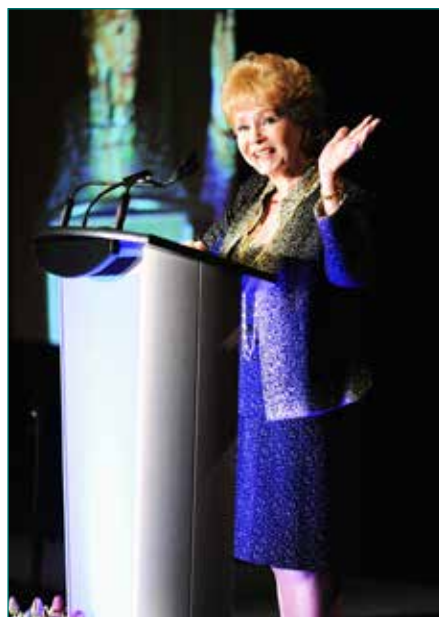
Debbie Reynolds Gala Ability and Beyond, 2012