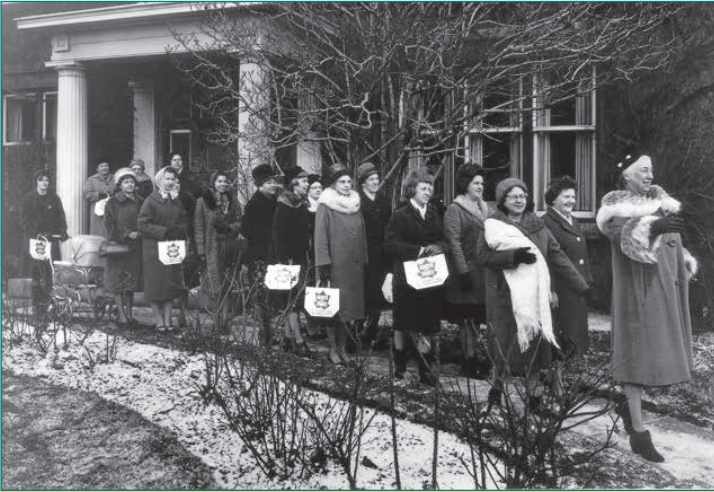
L'honorable Ellen Fairclough à la tête des Mères marchantes® qui ont fait du porte à porte pour recueillir des pièces de dix sous pour la recherche sur la polio dans les années 50. Un vaccin a été mis au point en 1955.