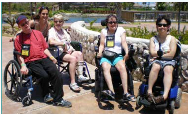
Des participants aux Services de loisirs prennent part à des vacances croisière

En 2012-2013, le programme de Voyages accessibles a fourni un soutien à des groupes de personnes handicapées lors de croisières vers la Floride, l'Alaska, Hawaï, les Caraïbes et de fréquents voyages dans la région du Niagara.