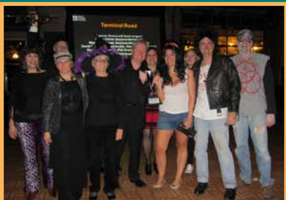
Rock for Dimes Halifax 2012

Pennzoil était le parrain de tous les événements Rock for Dimes organisés en 2013 pour célébrer la passion collective de Pennzoil et de tant d'autres pour les voitures et la sensation de liberté que procure le fait de conduire sa propre automobile.