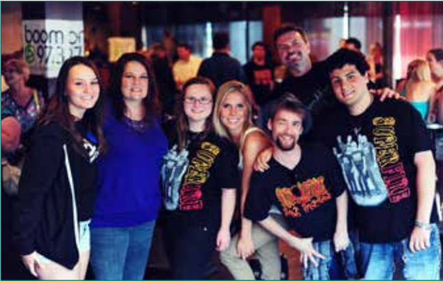
Le groupe Superfire avec des fans, à Rock for Dimes Toronto 2012